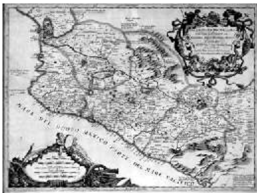
Parte de la Nueva España o México donde están las provincias de Guadalajara, Jalisco, Michoacán y México VINCENZO MARIA CORONELLI (1650 - 1718) Venecia, 1692 Grabado al buril coloreado 51 x 67 cm. Fundación E. Arocena

Esta exposición nos invita a explorar las constelaciones del cielo y los confines de la tierra a través de nueve mapas datados entre los siglos XVII y XVIII, una época considerada de oro para la edición cartográfica en los Países Bajos. Estas piezas nos demuestran que los cartógrafos también fueron artistas, ya que a los elementos científicos de la representación añadieron símbolos y colores decorativos que enriquecen la imagen.