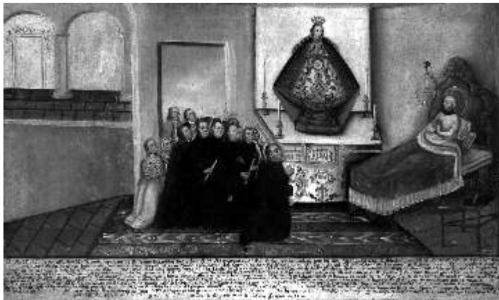
ANÓNIMO NOVOHISPANO Exvoto dedicado a Nuestra Señora de la Salud de Pátzcuaro, Michoacán. 1796 Óleo sobre tela. 45.7 X 75.5 cm. Fundación E. Arocena.

Por: Adriana Gallegos Carrión. Curadora. http://delmuseoimaginario.blogspot.com